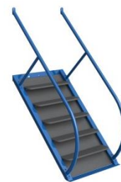
Option escalier : J160-OP01